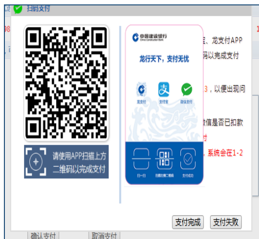
(聚合扫码支付界面)